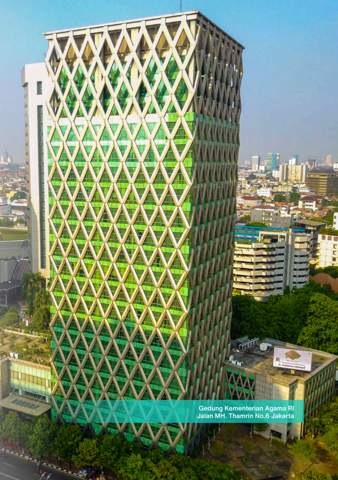
Gedung Kementerian Agama RI Jalan MH. Thamrin No.6 Jakarta