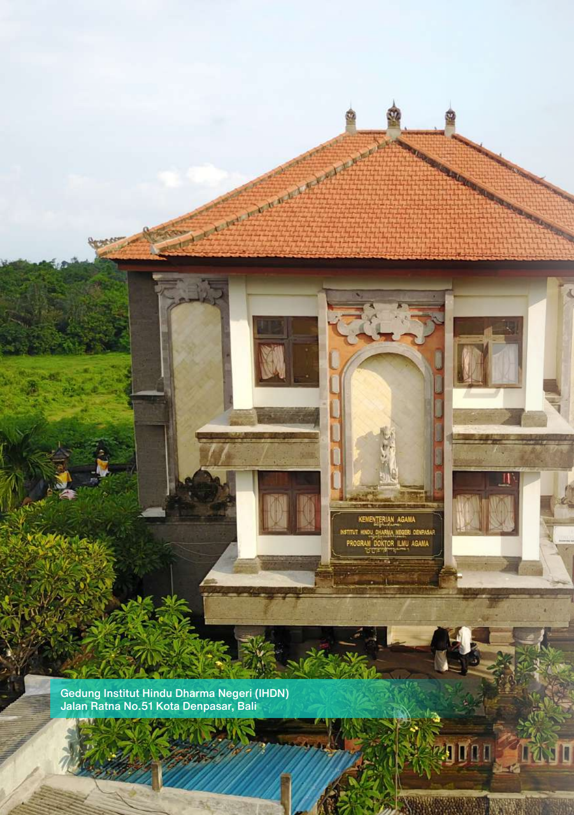
Gedung Institut Hindu Dharma Negeri (IHDN) Jalan Ratna No.51 Kota Denpasar, Bali