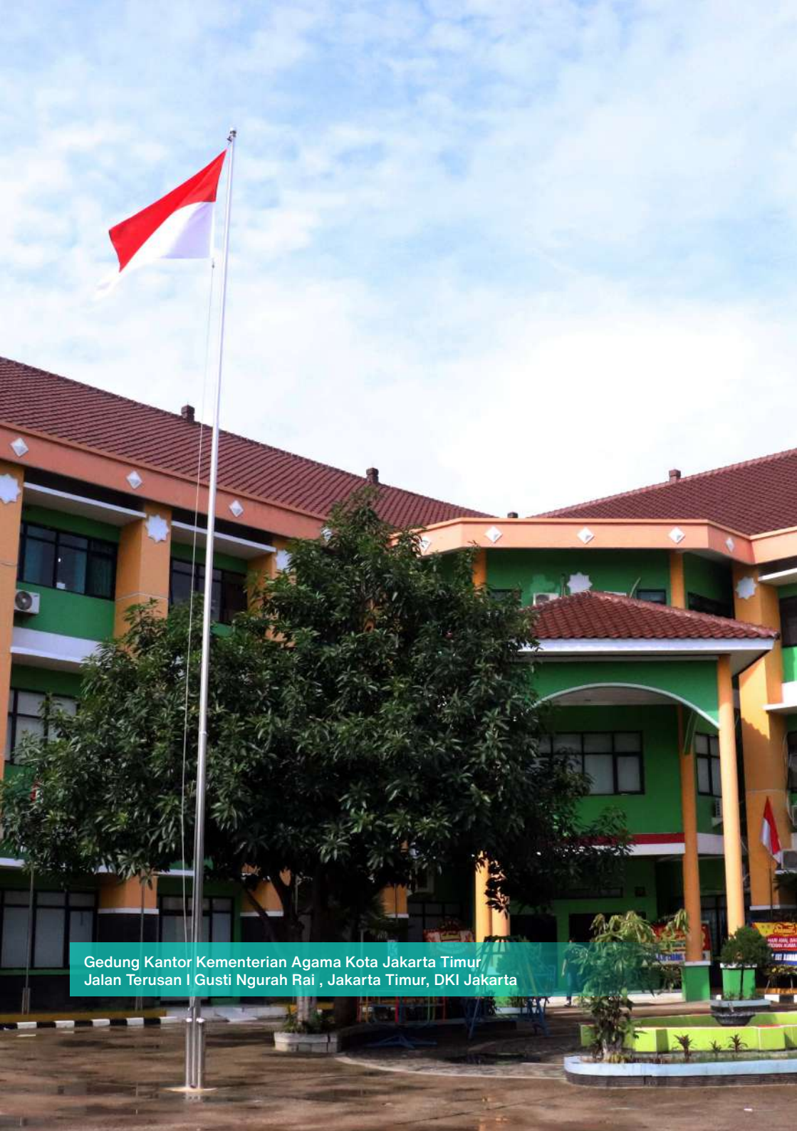
Gedung Kantor Kementerian Agama Kota Jakarta Timur Jalan Terusan I Gusti Ngurah Rai , Jakarta Timur, DKI Jakarta