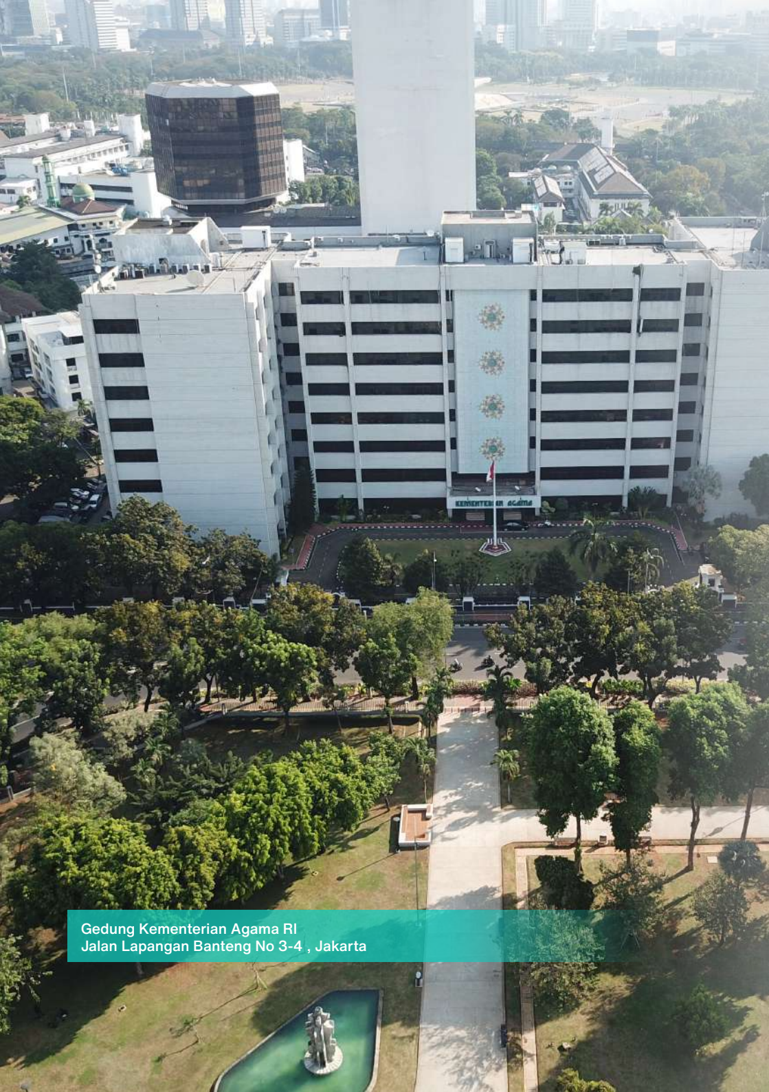
Gedung Kementerian Agama RI Jalan Lapangan Banteng No 3-4 , Jakarta