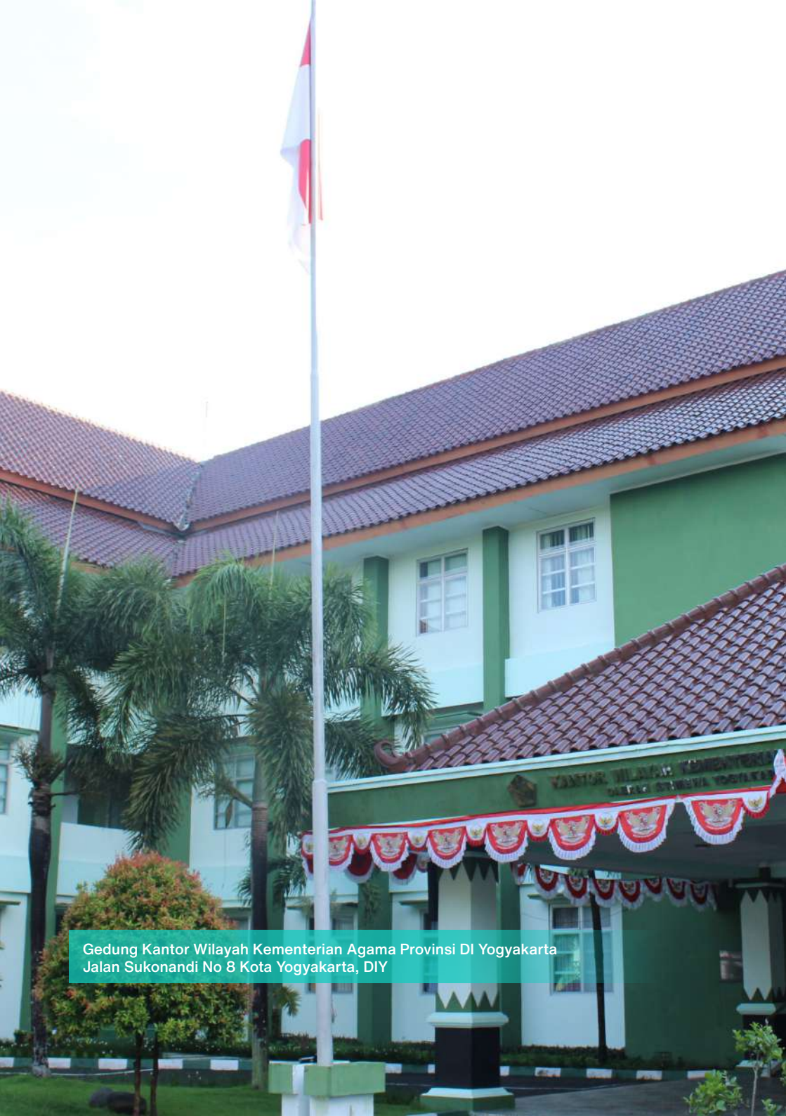
Gedung Kantor Wilayah Kementerian Agama Provinsi DI Yogyakarta Jalan Sukonandi No 8 Kota Yogyakarta, DIY